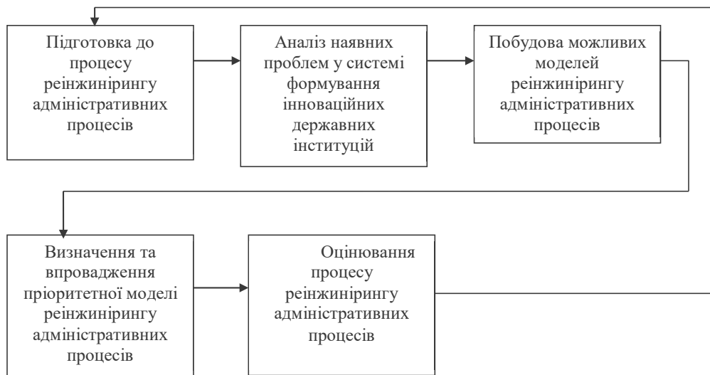
Рис. 1. Технологія реалізації реінжинірингу адміністративних процесів

й видозмінювати, вибудовуючи в єдину цілісну й ефективну систему;